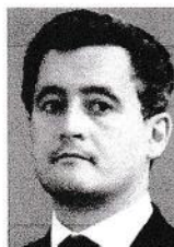
Gérard Darmanin. Le ministre de l'Action et des Comptes publics a dû faire face à une grève de tous les syndicats de fonctionnaires, le 10 octobre.

blème d'attractivité, les cadres du public étant déjà moins payés que ceux du privé (voir graphique). La question des enseignants est la plus préoccupante. Certes, la Cour des comptes a souligné, dans un récent rapport, les efforts entrepris en leur faveur. Les écarts avec leurs homologues des autres pays de l'OCDE se sont ainsi resserrés pour