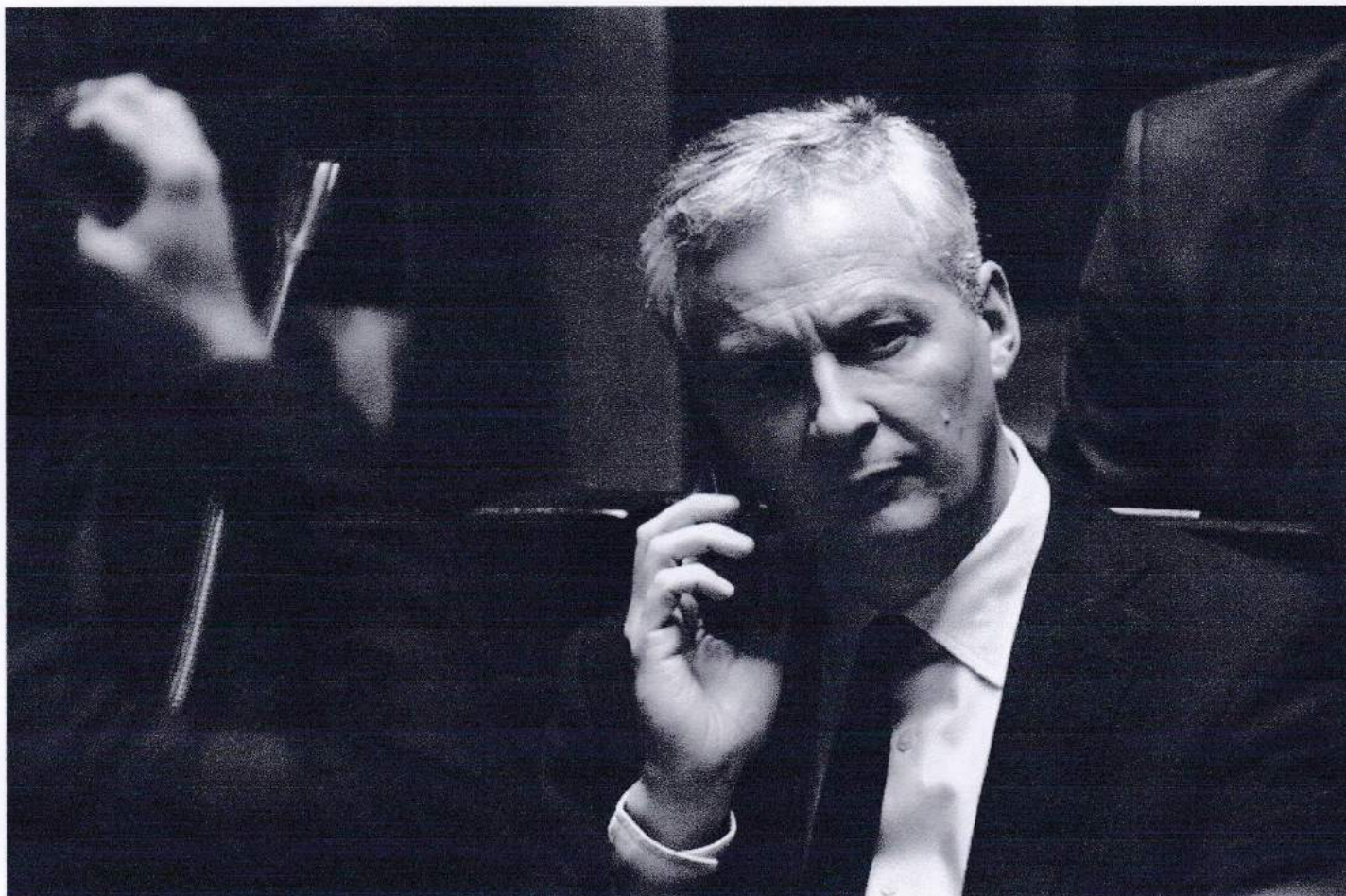
Le ministre de l'Économie Bruno Le Maire, à l'Assemblée nationale, en juin 2018.