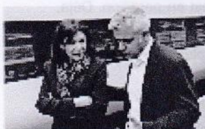
Paris et Londres annoncent une coopération économique