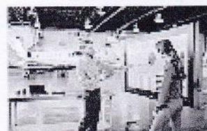
Gagnez en efficacité opérationnelle. Lire le rapport.