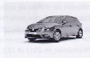
Ventes privées SEAT : Sur des véhicules neufs disponibles tout de suite