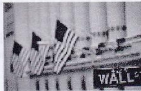
Wall Street reprend de l'élan et finit en hausse