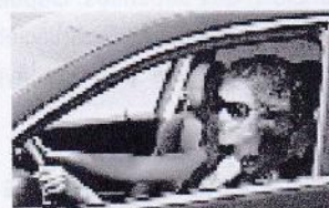
Vous roulez moins de 8000 km/an ? AXA a une très bonne nouvelle !