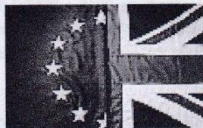
Royaume-Uni: une firme allemande sur 10 veut réduire sa présence