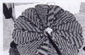
Révolution solaire: la Smartflower réinvente la production d'énergie chez soi