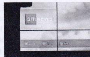
Le succès du kiosque SFR Presse inquiète certains éditeurs