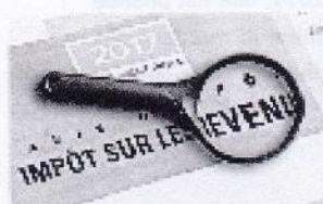
Ces français qui transforment leurs impôts en patrimoine retraite